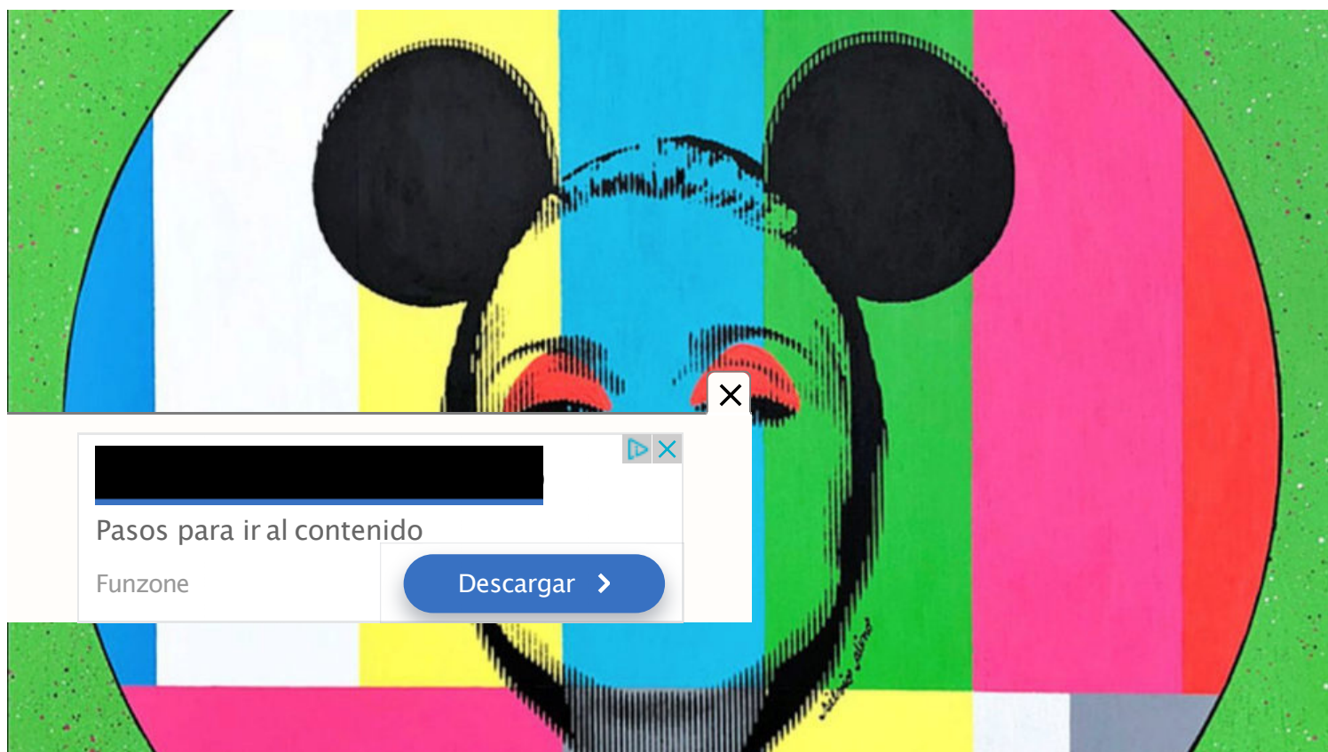
Técnica mixta sobre lienzo de Silvio Alino