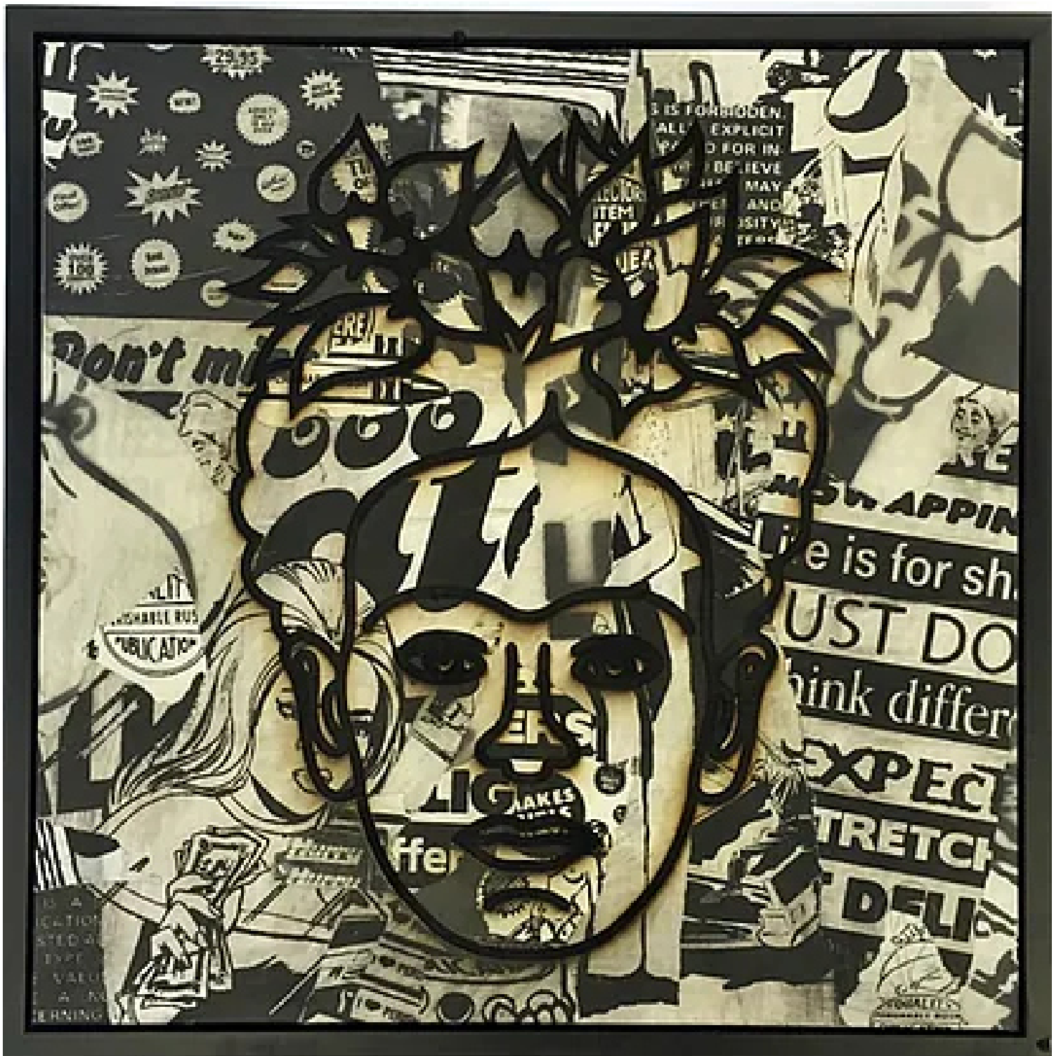
Grabado láser sobre collage y madera de Perishable Rush |

Ella gestiona, por tercer año consecutivo, este programa como Art Advisor, busca y selecciona obras de arte según los requisitos y el presupuesto de cada comprador, además de ayudar en la negociación en la adquisición de una obra: "Es un servicio pensado no solo para coleccionistas que llevan años comprando arte, sino que está indicado para cualquier persona que quiera comenzar a adentrarse en el mundo del arte y quizá iniciarse con una pequeña colección", asegura a Fuera de Serie.