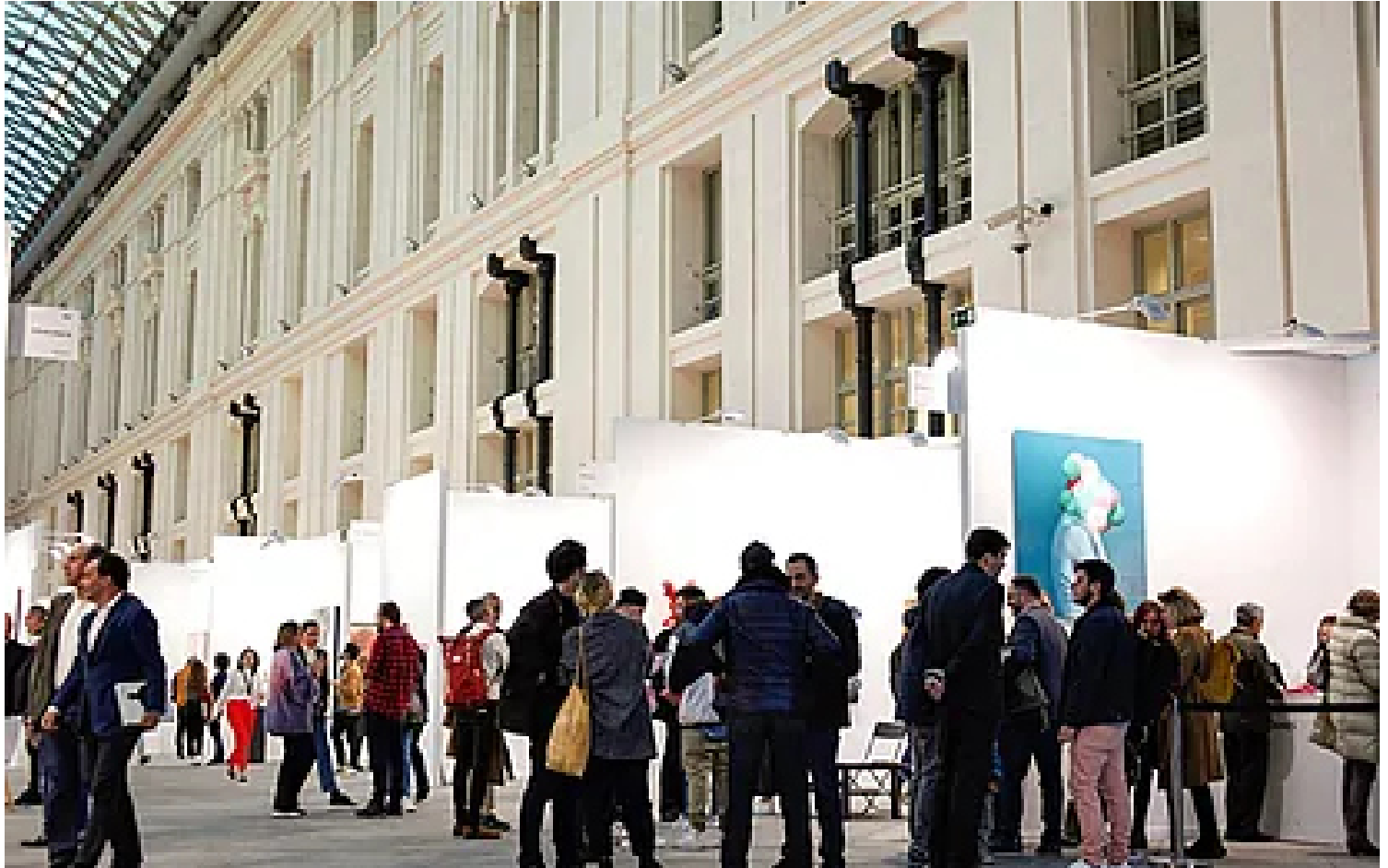
Vista general de la feria en palacio Cibeles |

solo para observar, sino también para comprender y conectar con las emociones que las obras evocan o La quedada , un interesante itinerario por los estudios de algunos de los artistas que estarán participando en Art Madrid24 y, por supuesto, el servicio de asesoramiento profesional y totalmente gratuito para galerías y público interesado en adquirir obras de arte.