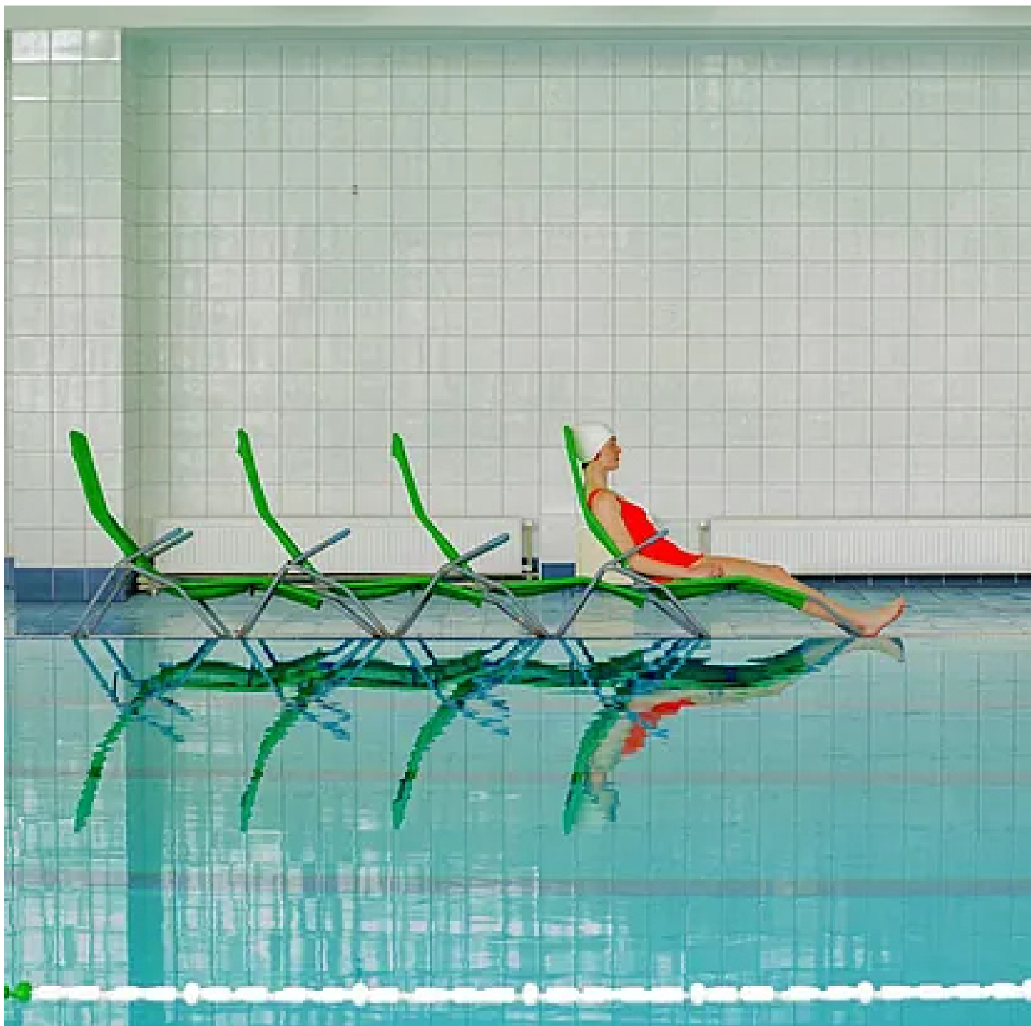
Impresión digital sobre papel de Mariiia Svarbova |

emergentes, nos permite desembolsar cantidades no muy elevadas y seguir la trayectoria de los artistas en los que hemos invertido.